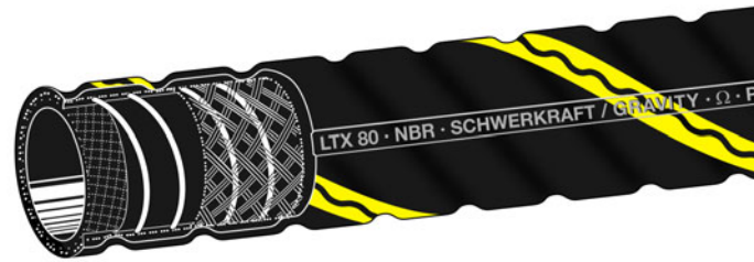
Kennzeichnung : Gelbe Spiralmarkierung und Prägebandstempelung

LTX 80 · NBR · SCHWERKRAFT / GRAVITY · Ω · PN 4 BAR · ELAFLEX © 03.08